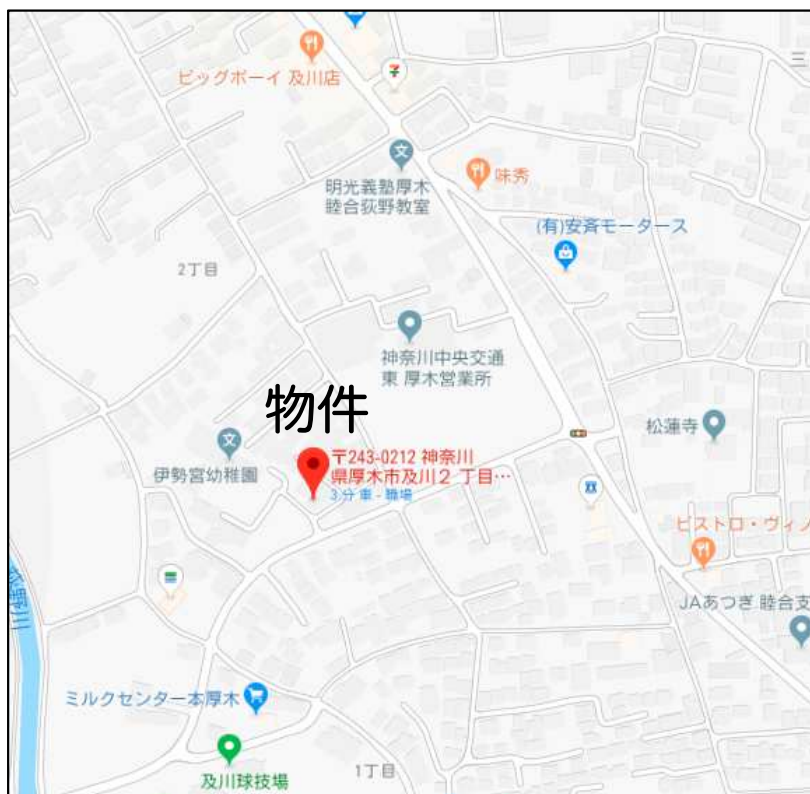
案内図（厚木市及川2-21-41）